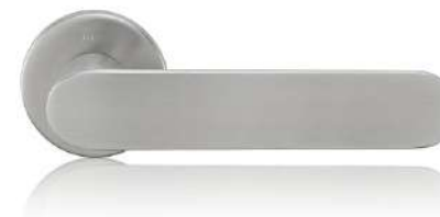
M&T klika s kulatou rozetou