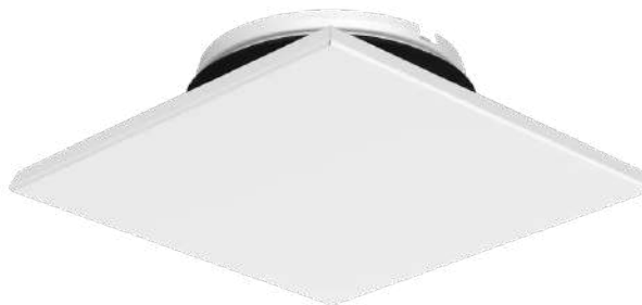
Odvodní hranatý ventil