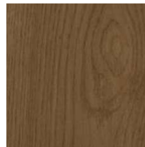
Dub tmavě hnědý