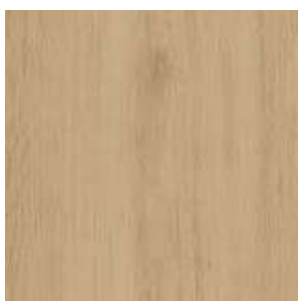
Vanilla Liberty Jasan