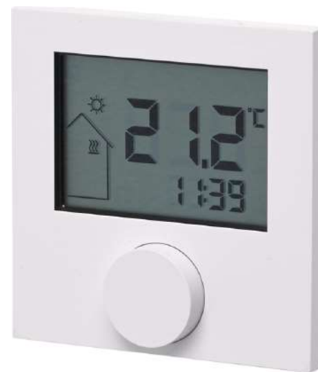
pokojový termostat, digitální s LC displejem