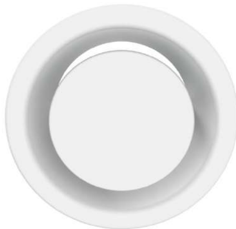
Odvodní talířový ventil