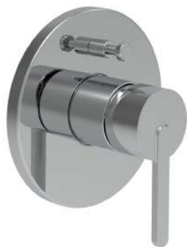
Laufen LUA, podomítkové vanové/sprchové baterie s přepínačem, chrom