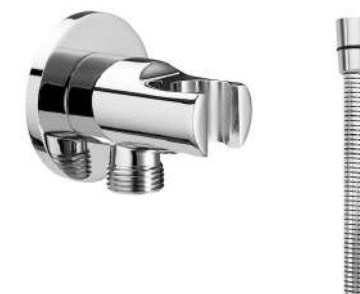
připojení sprchové hadice 1/2" s držákem ruční sprchy